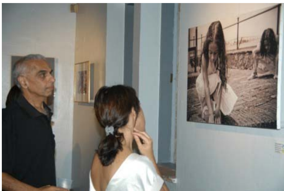
Innocence by the river van Simnne Reeder hangt aan de muur.-