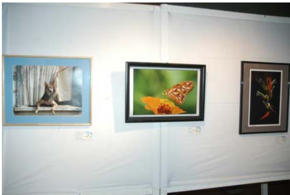
Een hond die het stratleven bekijkt, een vlinder op een bloem, nog een bloem.... Aan mooie dieren- en plantenfoto's ontbreekt het niet. De expositie is gratis.-