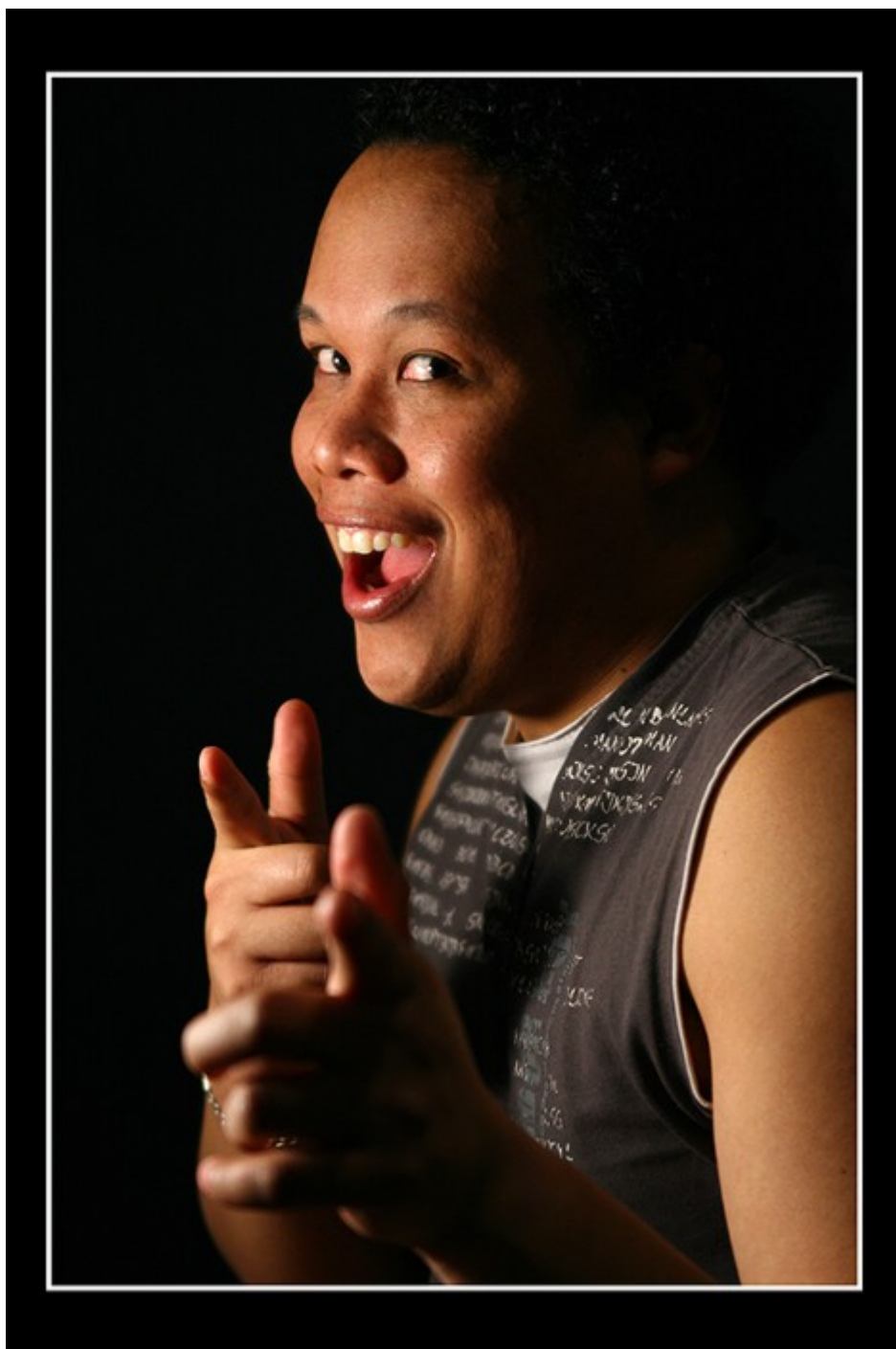
Een zelfportret van de fotograaf.-.